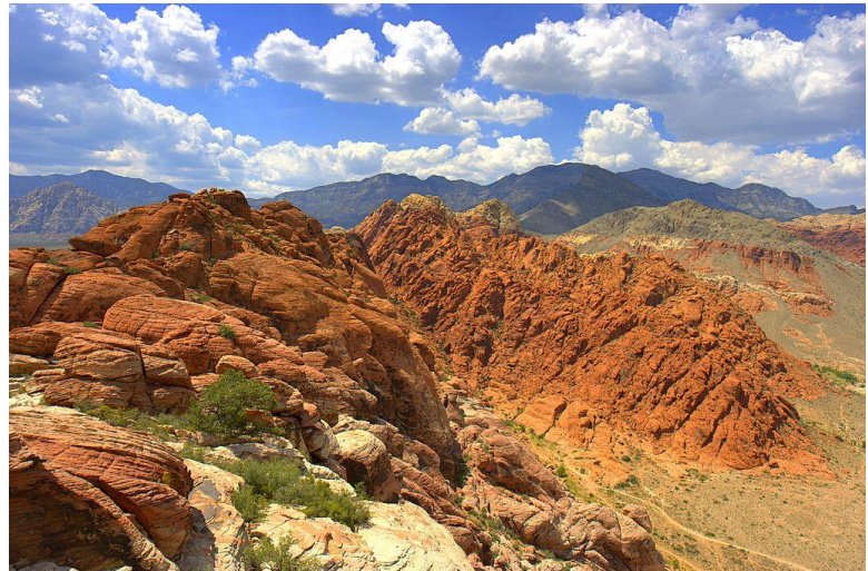
Foto del desierto de Mojave

Dan cruza el desierto de Mojave en busca de algo para comer. Se encuentra con un gran cañón lleno de arena. Parece que muchos otros animales han optado por rodear el pozo para evitar luchar por la arena.